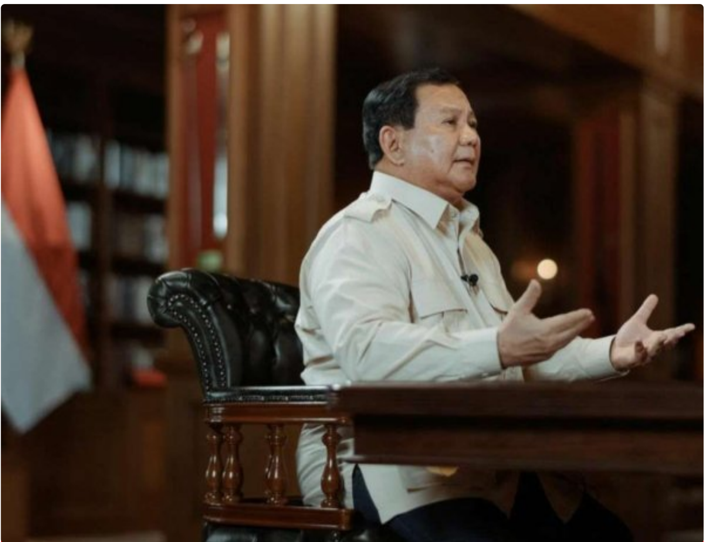
Prabowo Subianto Presiden RI 2024-2029

PENDIDIKAN - Indonesia dikenal sebagai negara yang kaya akan sumber daya alam . Dari hasil tambang yang berlimpah, laut yang luas dengan kekayaan hayati yang melimpah, hutan yang menjadi paru-paru dunia, hingga sumber daya energi yang tersebar di berbagai wilayah, semuanya menjadi kekuatan besar bagi